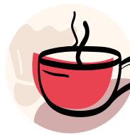
Austausch & Freizeit