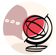
Migration & Integration