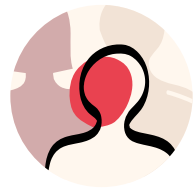
Frauen, Männer, Jung & Alt